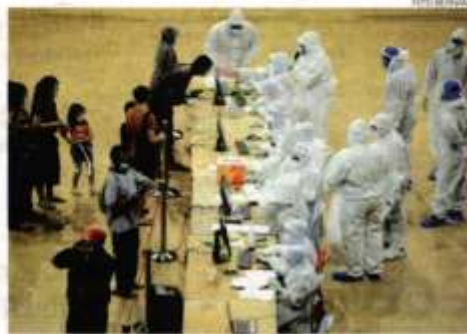
Petugas kesihatan membuat persediaan dan merokok kehadiran pesakit Covid-19 di CAC di Stadium Malawati Shah Alam.

kami akan masukkan mereka ke pusat rawatan berisiko rendah atau hospital untuk dipantau dan rawatan yang berterusan," katanya.