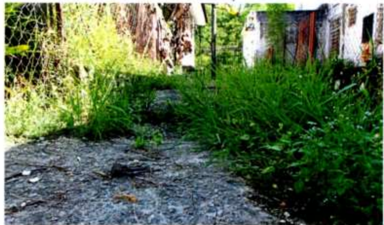
The undergrowth and shrubs at a back lane in Taman Lestari Putra have led to leaves and branches falling into nearby drains, obstructing water flow.

"The debris stopped the water flow and increased the risk of Aedes mosquitoes